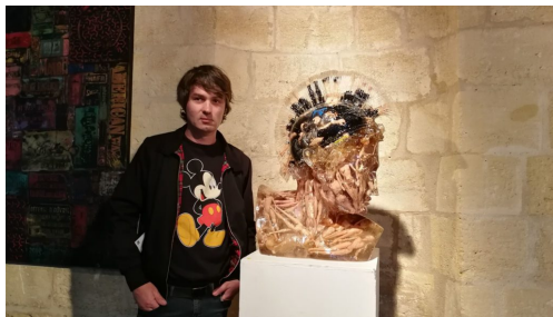
Alben, exposition Time Capsule aux Vivres de l'Art